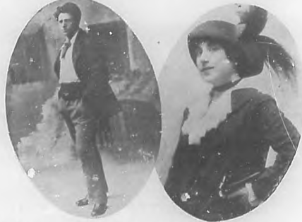
La ópera en el Metropolitano de New York.—Giovani Martinelli, tenor; Lucrecia Bori, tiple lírica.

la maestría y es pirit peculiar en él. Allí estaba congregada la aristocracia neoyorkina, sin que notásemos la ausencia de las familias cubanas más prominentes de la ciudad.