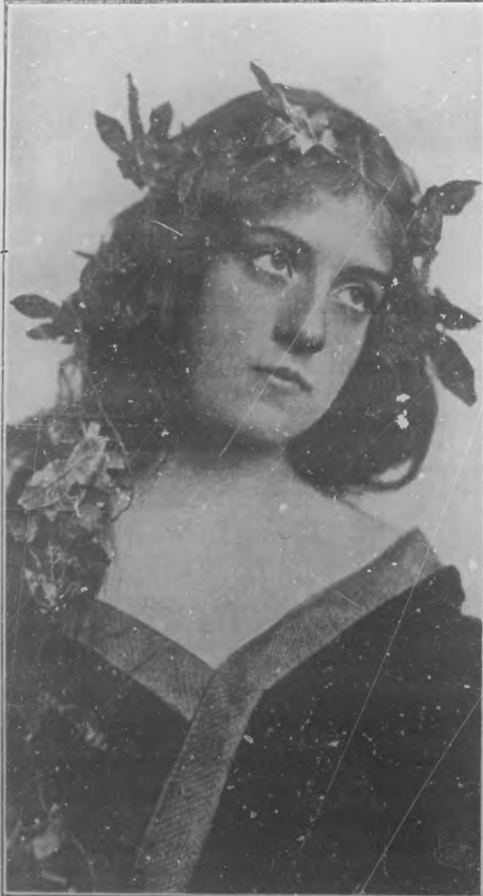
El corazón sobre sus labios y el alma en sus ojos.—Byron.