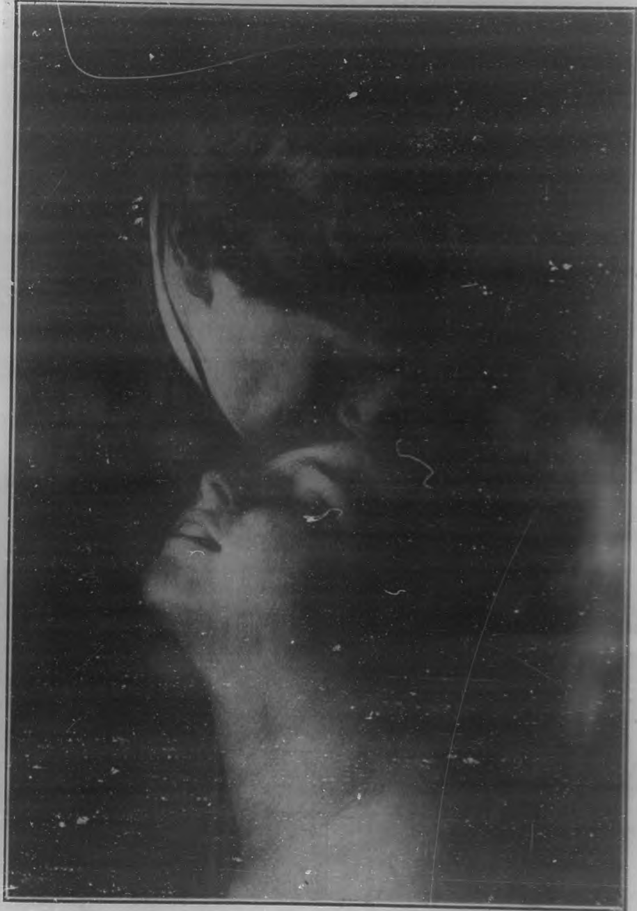
EL BESO.—Dibujo por M. Feliú.