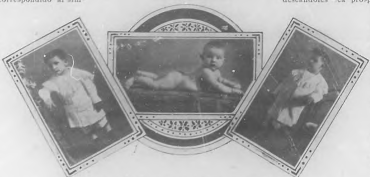
ENRIQUE, EMILIO Y BARTOLOME GRACIAS Y VEILE

Lo participamos á sus muchas amistades deseándoles sea próspera.