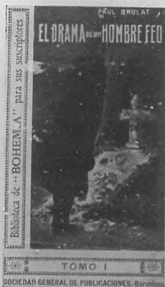
Portada de la novela «El drama de un hombre feo» en dos tomos, original del ilustre literato Paul Brulat que regalará «Bohemia» á sus suscriptores el mes de Diciembre.

En el número próximo y en página interior daremos publicidad á las bases que reglamentan las condiciones del concurso de poesía convocado por el Comité, en el que se otorgará una medalla de oro al autor de la mejor poesía que se presente dedicada á la insigne cantora.