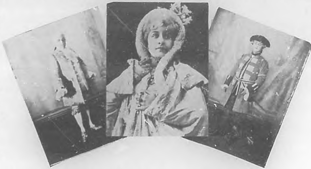
La ópera en el Metropolitano de New York.—De izquierda á derecha: Enrico Caruso, tenor; Geraldina Farrar, primera tiple; Dink Gilly en «Manon» de Massenet

La tiple Destin hizo una «Gioconda» como ella sabe hacerlo. De Seguroia, que ese público conoce bien, cantó y actuó admirablemente, y Toscanini dirigió la orquesta con